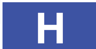
Arrêts de travail, accidents

Adhérer au Service de Remplacement Charente avec le contrat d'assurance «Main d'oeuvre-remplacement» Groupama en début de chaque année vous permet d'être remplacé à un tarif réduit et d'assurer la continuité de votre production.