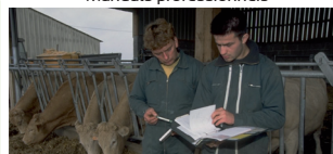
Salarié à temps partagé