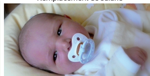
Congés maternité et paternité