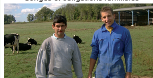
Remplacement de salarié