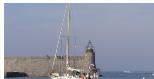
Congés et obligations familiales